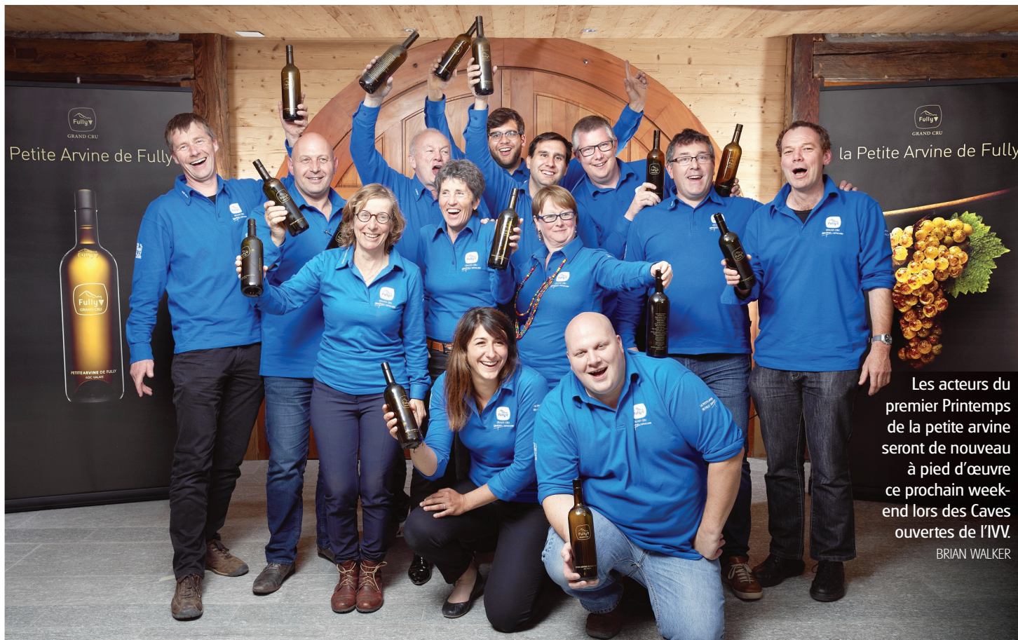
Les acteurs du premier Printemps de la petite arvine seront de nouveau à pied d'œuvre ce prochain week-end lors des Caves ouvertes de l'IVV. BRIAN WALKER