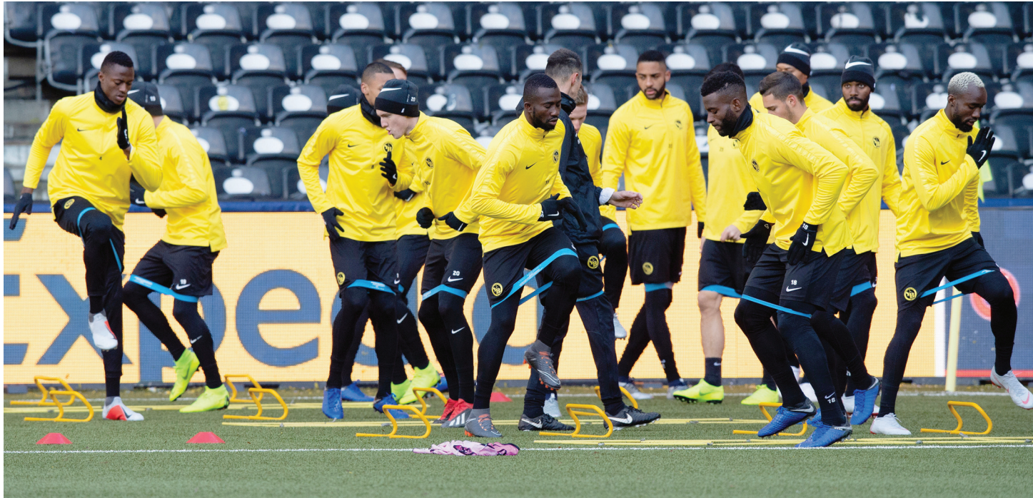
Les Bernois tenteront l'impossible à domicile, eux qui avaient chuté 3-0 à l'aller.

Il est tentant d'affirmer que la dernière rencontre de Ligue des champions que va disputer Young Boys ce soir à 21 h 00 contre la Juventus compte pour beurre. Tentant mais totalement faux. Il n'est pas donné à tous les clubs ni à tous les joueurs la possibilité de faire chuter ce géant du football et un résultat positif, même s'il ne changera rien au classement des Bernois condamnés à la dernière place du groupe, s'apparentera à un réel exploit. Tant la Juve est supérieure et tant l'enjeu est, pour les Turinois, important.