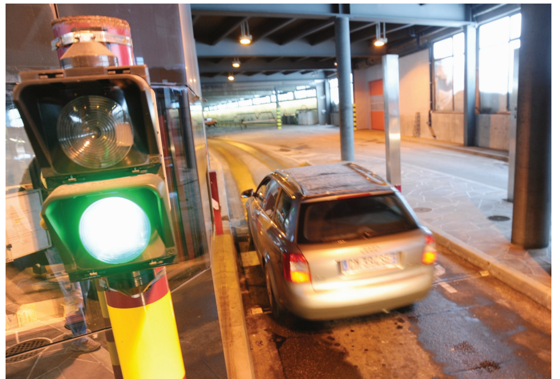
Ce sont les mois d'été qui connaissent les plus fortes affluences au tunnel du Grand-Saint-Bernard. En 2011, le record a été enregistré le 30 juillet avec 6197 véhicules au total.